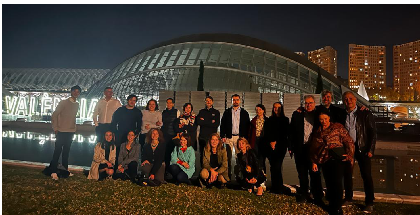
⤴ Incontro del Consorzio Valencia (ES)

Ci ritroveremo presto a Roma ad aprile 2024, ospitati da UniverCities!